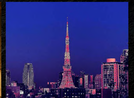
Tokyo Tower View (Roof Balcony)